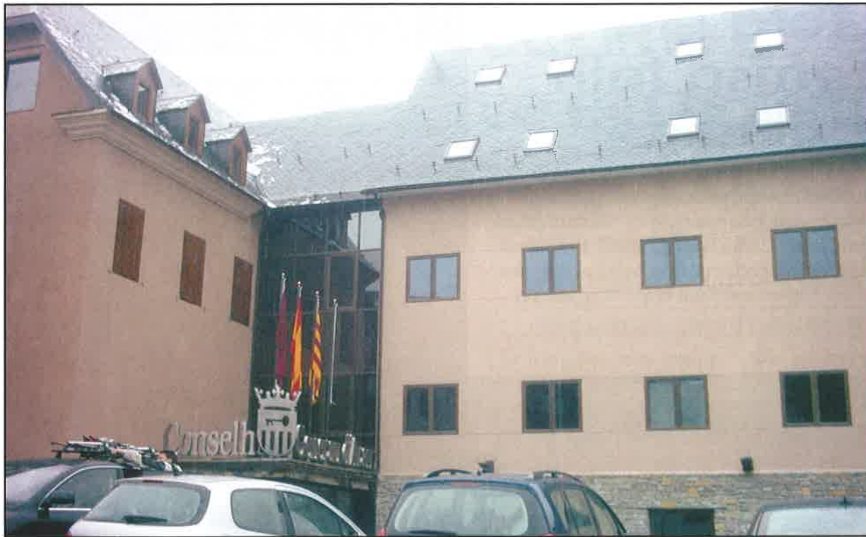
El edificio que alberga la máxima institución aranesa.