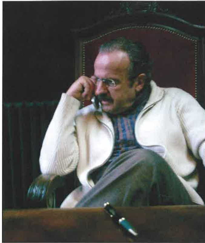
Imatge d'archiu der alcalde de Vielha.

A Vielha li manquen parcatges. Damb er airau dera casèrna militar, coma encaratz aguest deficit?