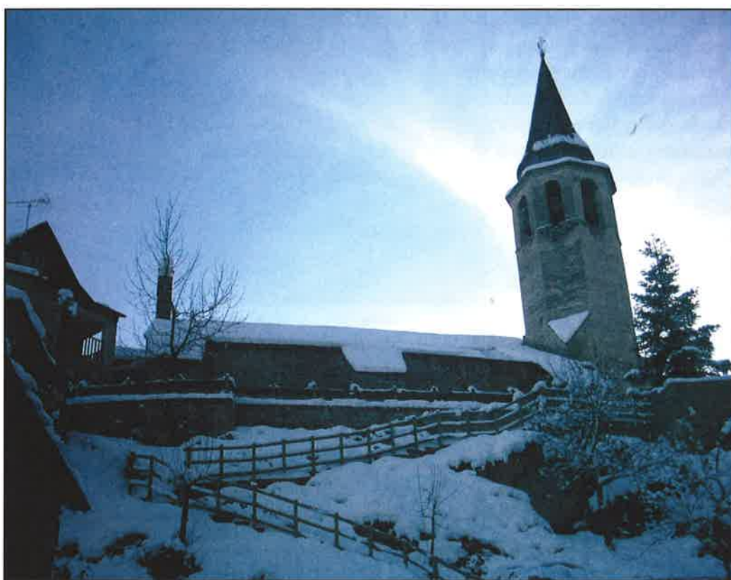
Er entorn deth monument romaníc de Santa Eulàlia.