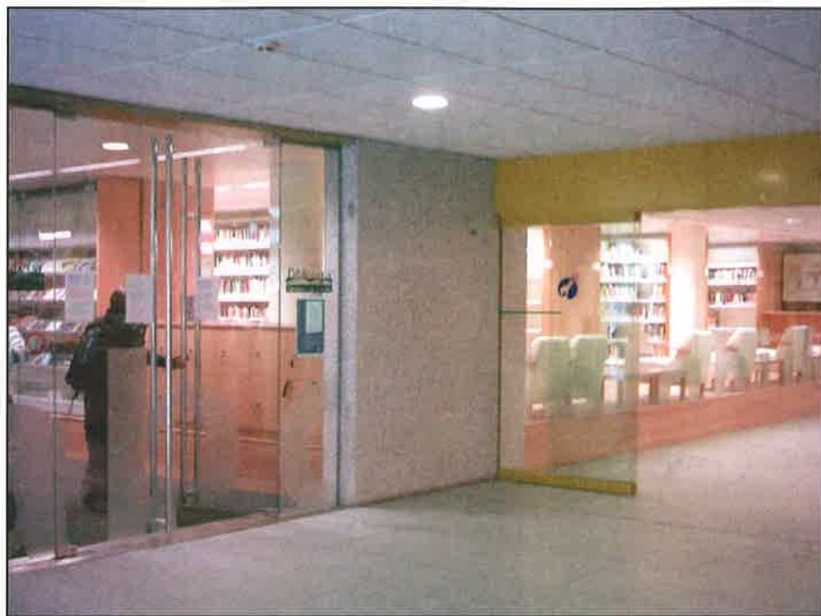
La biblioteca general de Vielha.

L 'Aran necessita l'articulació en xarxa d'un sistema interbibliotecari públic amb una biblioteca central que conservi el patrimoni bibliogràfic de tot el que es publica sobre i a la Vall, perquè l'accès a la informació i al coneixement és un dret bàsic que han de garantir els poders públics a tots els ciutadans del país, una àrea condicionada per la dispersió dels nuclis urbans –allunyats de les ciutats–, els fluxos turístics i laborals i sobretot els interessos que com a comunitat nacional queden reflectits en la llengua i cultura pròpies.