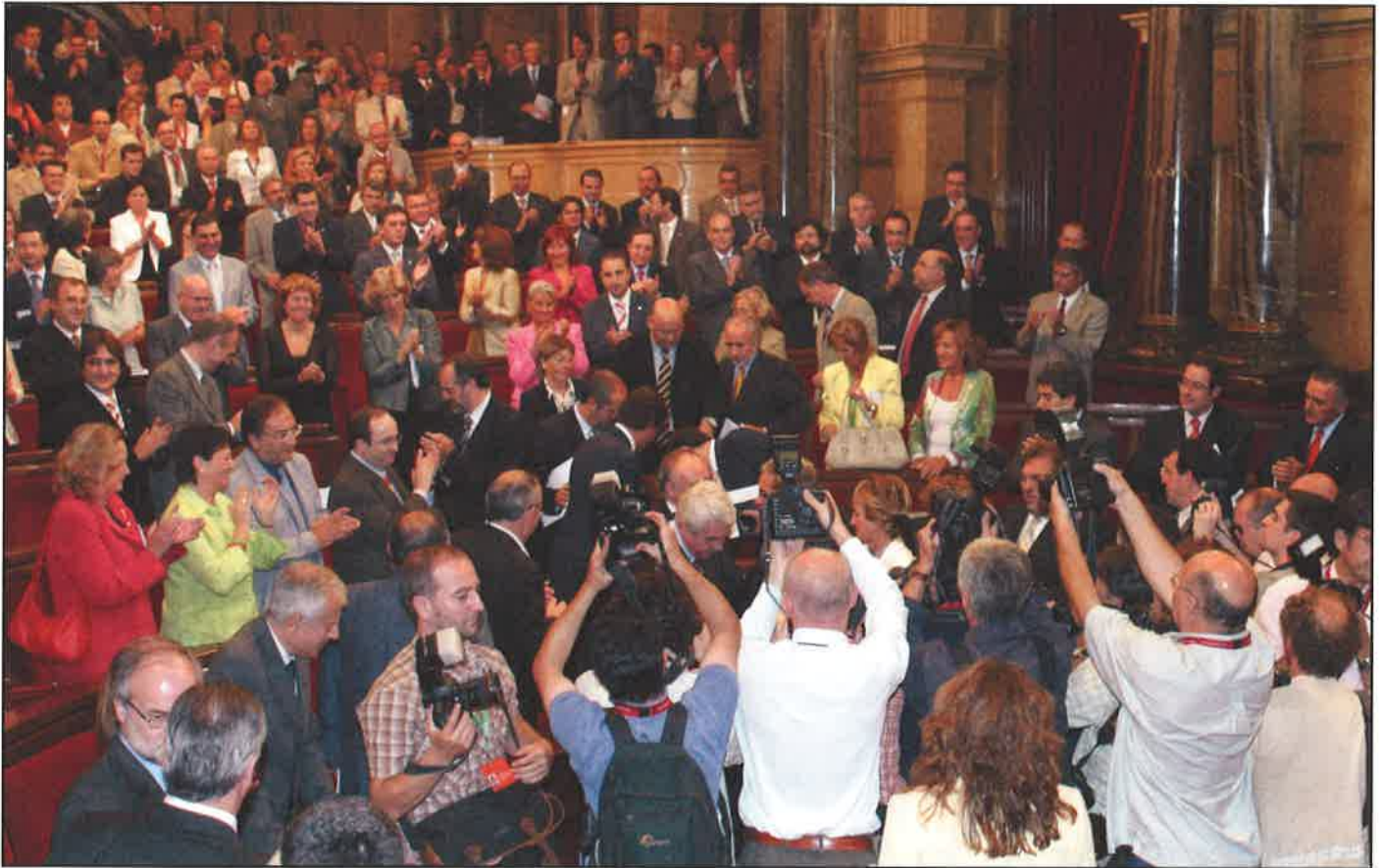
Er emicicle, eth 30 de seteme despús dera aprovacion per 120 vòts a favor e 15 en contra.

ARAN E CATALONHA > Eth Parlament apròve era prepausa de reforma