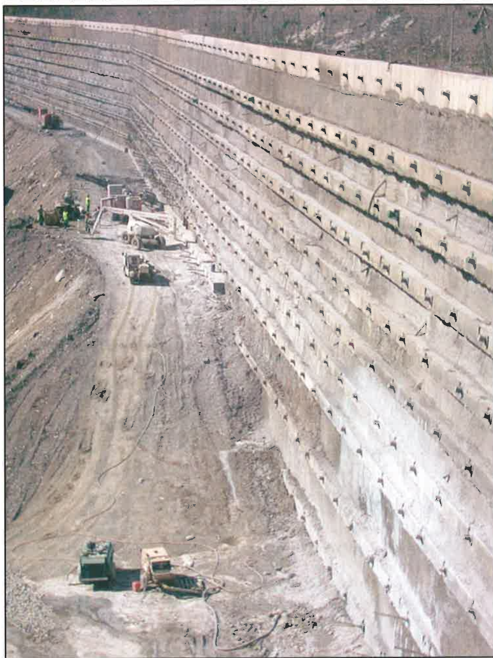
AQUEST ÉS EL MUR DE CONTENCIÓ DE LA VALL DE RUDA, QUE PROTEGIRÀ LA ZONA HOTELERA I QUE FA 400 METRES DE LLARGADA I UNS 40 D'ALÇADA