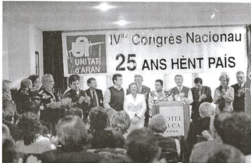
Un des moments deth IVau Congrès Nacionau d'Unitat d'Aran.

Con el IVau Congrès Nacionau, Unitat d'Aran se siente más fuerte políticamente por su creciente apoyo popular en las últimas elecciones. Por ello reivindica que Aran tenga representación propia en el Senado y apuesta por abrirse a la sociedad aranesa con la voluntad de conseguir un Aran más justo y democráticamente más participativo.